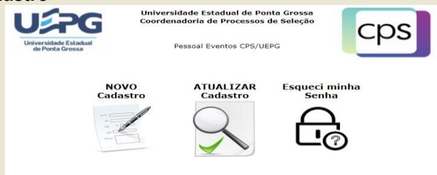
Figura 3: opções disponíveis no sistema de cadastro