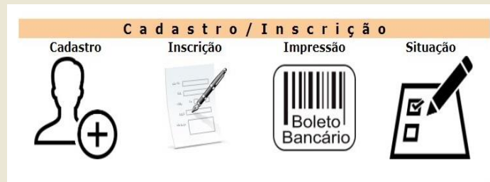
Figura 8: opções de inscrição no vestibular

1 - O link de acesso ao vestibular é https://sistemas.cps.uepg.br/vestibular/outono_ingresso_2022