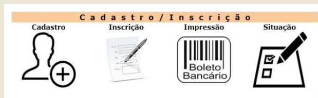
Figura 2: opções disponíveis no sistema de cadastro